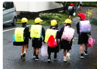
【みんなで仲良く登校】

さて、新たに24名の新1年生を迎え、児童数126名、8学級で令和6年度がスタートしました。学校ではこののびりを掲げ、子供たちの入学・進級をお祝いしているかのように、大空を勇壮に泳いでいます。学級担任との出会いは本当に奇跡的なものです。同じ場所で、同じ空間、同じ時間を過ごす日々の貴重な瞬間を一日一日大切に過ごしてほしいと願っております。そして、できなかったことができるようになった成長を実感できる一年にしてほしいと思います。