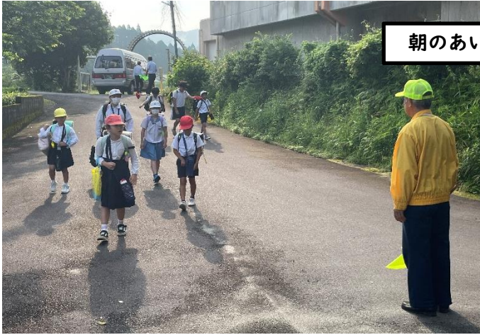
朝のあいさつ運動