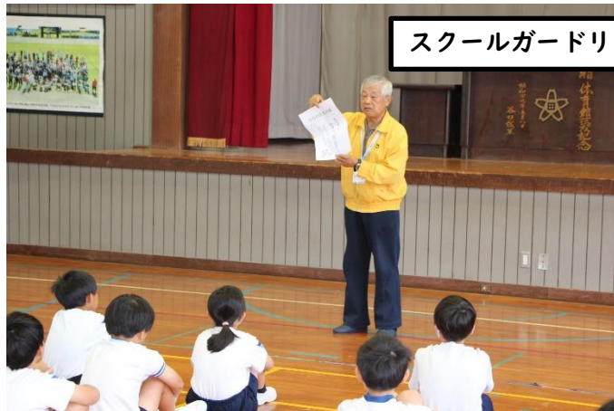
スクールガードリーダーの紹介と講話