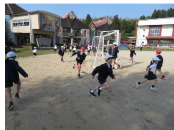
4/16 新入生を迎える会