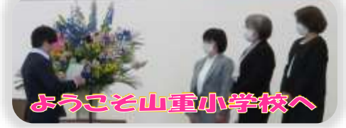
ようこそ山重小学校へ