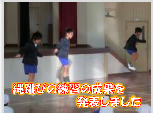
縄跳びの練習の成果を発表しました