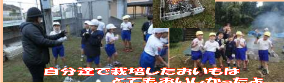
自分達で栽培したおいもは とてもおいしかったよ