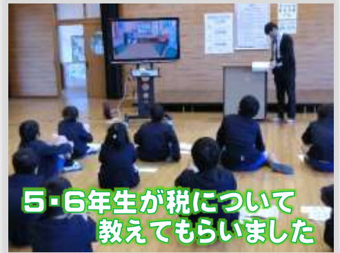
5・6年生が税について教えてもらいました