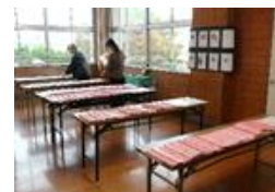
【展示作品～総合的な学習の時間・各教科】