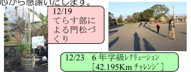
12/19 てらす部による門松づくり

年度末から年始にかけて、PTAや地域の方のご協力により、以下にあります行事を、充実した中で実施することができました。ご多用の時期に、多くのご支援をいただきましたことを心から感謝いたします。