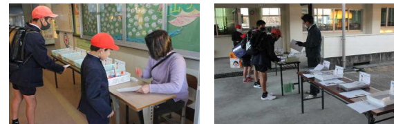
【玄関での朝の検温の様子】

2月にはテラスくんフェスタ、そして3月は卒業式、修了式と大きな行事も控えています。それまでには収束し、通常の学校行事が進められるように願っているところです。