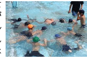
<1・2年生ゴルフボール拾い>

大雨の影響で臨時休校があったために、校内水泳大会が9日(火)に延期されました。急な変更にも関わらず、応援に駆けつけてくださいました。十分に練習できずでしたが、精一杯のがんばりを見せてくれました。低・中・高に分かれての発表会でしたので泳力がついていく様子がよく分かりました。