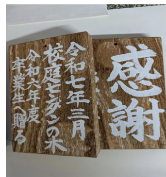
【卒業記念プレート】