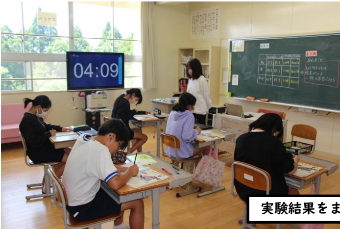
実験結果をまとめる6年生