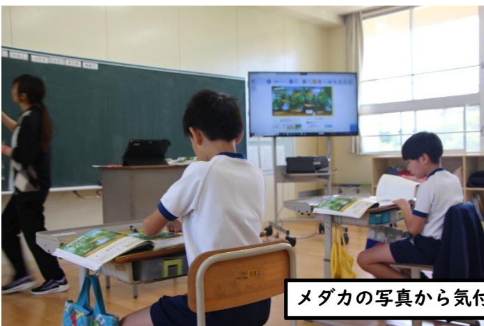
メダカの写真から気付くことを考える5年生