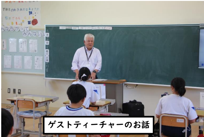
ゲストティーチャーのお話