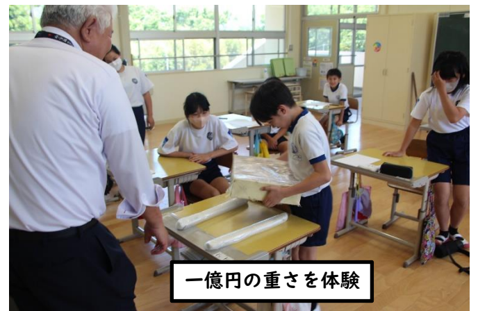
一億円の重さを体験