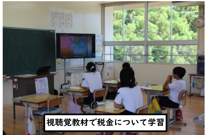
視聴覚教材で税金について学習