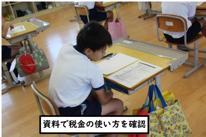
資料で税金の使い方を確認