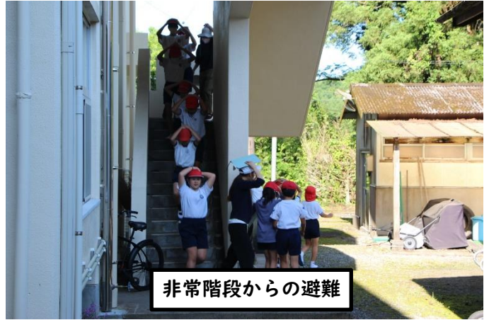
非常階段からの避難