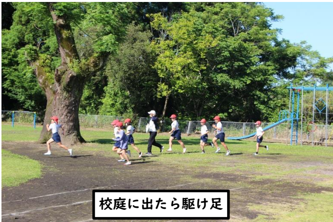
校庭に出たら駆け足