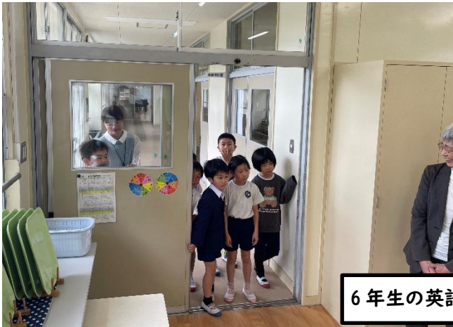
6年生の英語の学習の見学