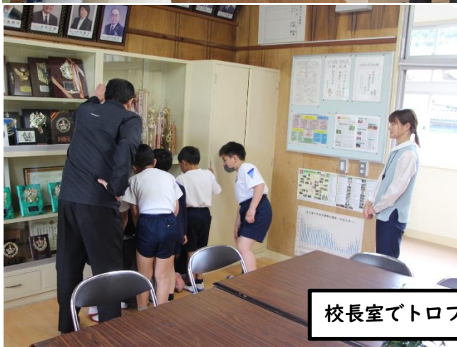
校長室でトロフィーに興味津々