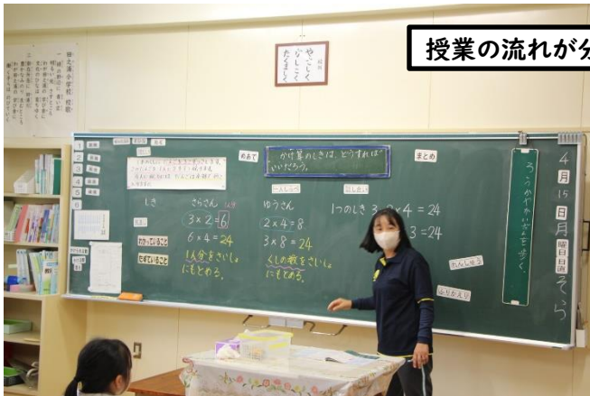
授業の流れが分かりやすい板書