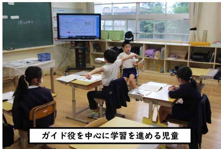
ガイド役を中心に学習を進める児童