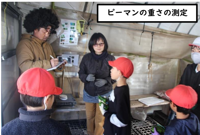
ピーマンの重さの測定