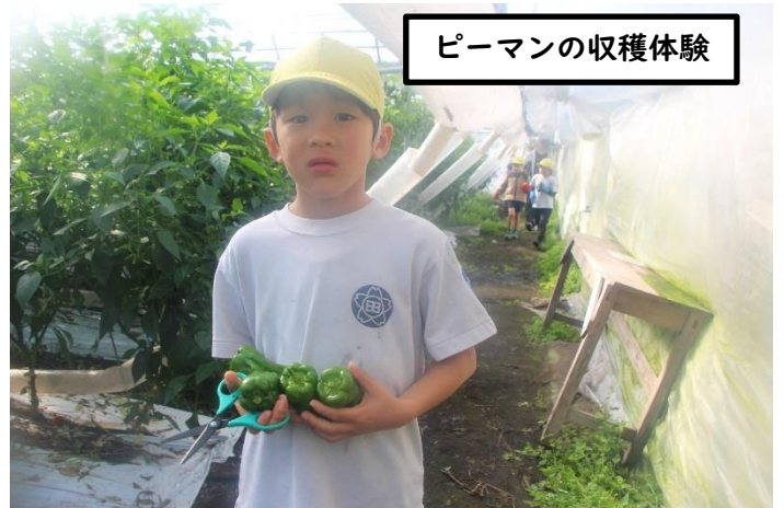
ピーマンの収穫体験