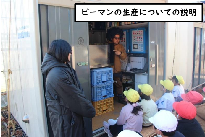
ピーマンの生産についての説明