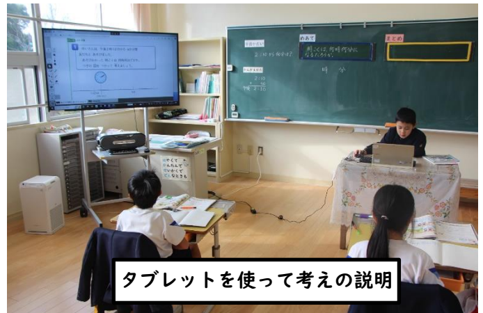
タブレットを使って考えの説明