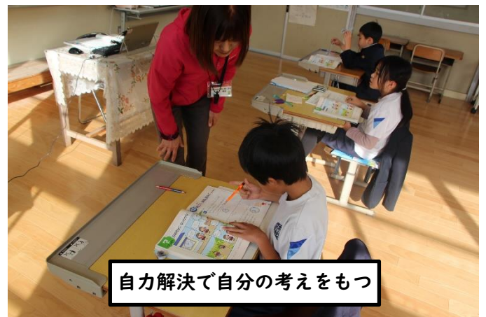
自力解決で自分の考えをもつ