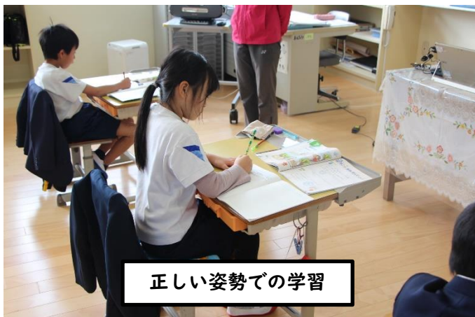
正しい姿勢での学習