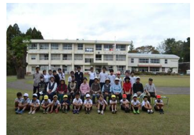
【御在所会の皆様と】