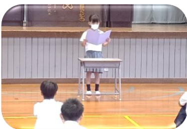
始業式 児童代表のこたば

いじめはどのような理由があっても絶対にゆるされません。思いやりの気持ちを行動に表し、みんなが笑顔で毎日を送ることができる、自分も友達も好きと言える田之浦の子供たちであってほしいと思います。いじめ問題についてしっかりと取り組み、いじめのない学校を目指します。