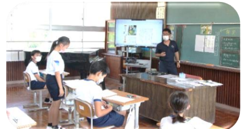
授業参観 道徳の授業