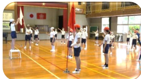
運動会 開会式の練習