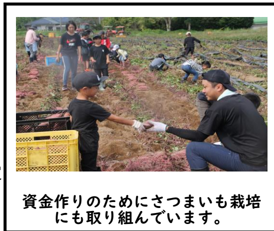
資金作りのためにさつまいも栽培にも取り組んでいます。

寄付は、秦野小またはアイショップに持って来ていただくか、振込（ゆうちょ、JA）の方法もあります。