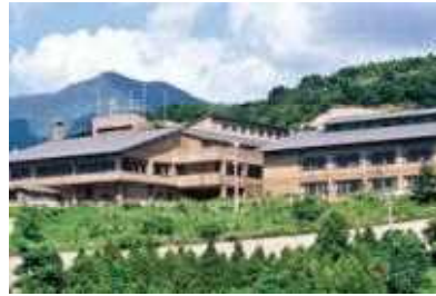
大隅自然の家【おおすみくん家】