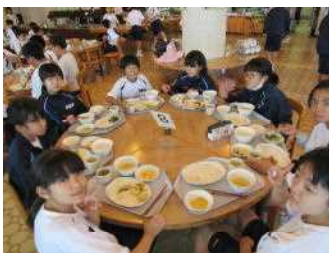
全ての活動を終えての昼食