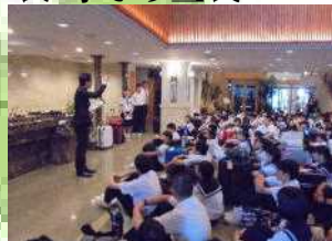
長崎での夕食(ホテル)