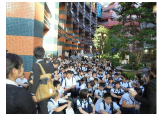
キャナルシティー