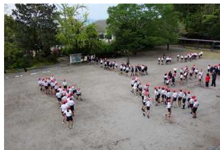
学級毎に長縄跳び

志布志小では毎朝7：50～8：00に5・6年生が「朝のボランティア活動」に取り組んでいます。4～5年前に始まりましたが、今ではすっかり定着し、子供たちの中にボランティアの精神が根付いてきています。