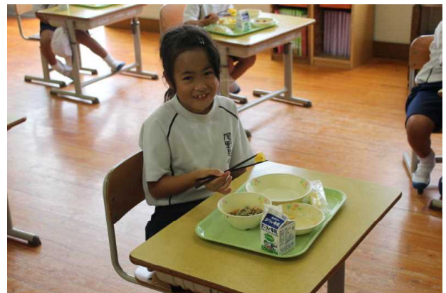
おいしいもの食べると笑みがこぼれます