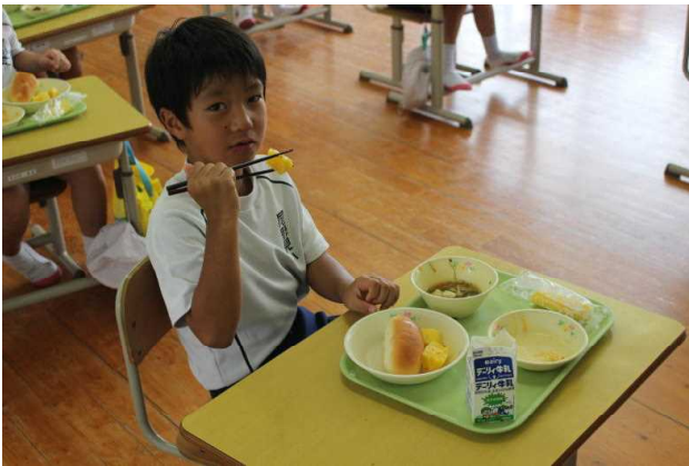
まずはおのみパイナップルから

6年生が収穫したパイナップルを9月23日の給食時間に全校児童で試食しました。その日の給食にはステックパイン（冷凍パイン）も出ていて、おのみパイナップルと味くらべをすることができました。どちらもとってもおいしかったです。尾野見地区ふるさとづくり委員会の皆様どうもありがとうございました。