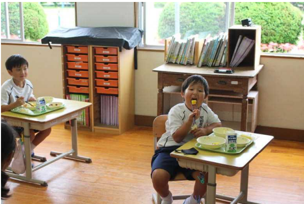
アイ ハブ ア パイナップル！