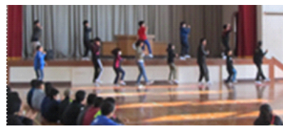
上写真 草スキー 下写真 六年生も飛び入りダンス