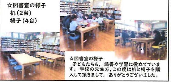
☆図書室の様子 机(2台) 椅子(4台)