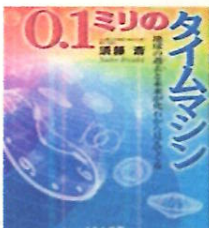
「0.1ミリのタイムマシン」 目にみえないほどの小さな化石から、「地球の瞬間のものさし」が正確になった話です。