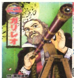
「ガリレオ・ガリレイ」 イタリアの自然科学者 数学者・天文学者