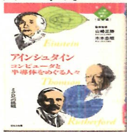
「アインシュタイン」 ノーベル物理学賞 時間の長さなど