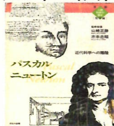
「ニュートン」 万有引力の法則 重力について