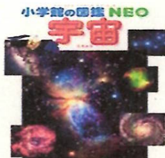
「宇宙の図鑑」 わたしたち人間は「星のかけらから」まれました。