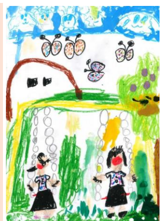
↑ 県民週間ポスター