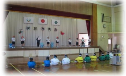
1・2年生の発表の様子

毎年県民週間に合わせて、学習発表会や教育講演会を開催していました。昨年度は、新型コロナウイルス感染症拡大防止の観点から、学習発表会を全体ではなく、学級単位で行いました。本年度は、参観者の制限や手指消毒、マスク着用などに気を付けたり、子供たちや保護者を入れ替えたりすることで、全体での学習発表会を実施することができました。子供たちにとっては、日頃の頑張りの成果を発表できる貴重な機会でした。積み上げてきた学習を、緊張しながらも立派に発表することができました。子供たちの頑張っている姿はいかがでしたか。コロナ禍の中ですが、元気に意欲的に学習に取り組んでいます。保護者の皆様の参観やご協力本当にありがとうございました。