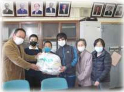
〈老人クラブより雑巾の寄贈〉

学校運営協議会は、学校、保護者、地域が一体となり、子供たちの健全育成のための環境づくりを目指して活動を行っています。おやじの会や家庭教育学級は、保護者が主体的に学校環境を整備したり、子育ての研修会を開いたりしています。毎年年末にはおやじの会で門松作りを行っています。家庭教育学級では、1年生の保護者が中心となって、子育て、食育、SNS等について学んでいます。