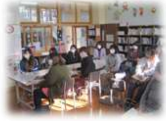
〈家庭教育学級の様子〉