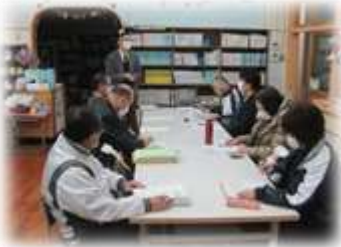
〈学校運営協議会の様子〉

日頃より松山小の教育活動への御理解・御協力を感謝いたします。たくさんの方々の応援をいただき松山の子供たちの健全育成が図られていると実感しています。年間を通して、多くの活動を行ったので紹介します。