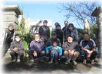
〈おやじの会の活動で作成した正門の立派な門松〉