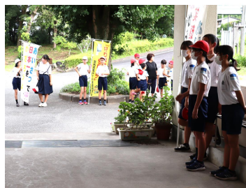
【朝のあいさつ運動の様子】

この先も、6年生が活躍できる場面を意図的に増やしていくとともに、香月小学校の子どもたちがそれぞれで主体的な活動を行えるように応援していこうと思います。保護者・地域の皆様も、ぜひ子どもたちの生き生きとした「輝き、紡ぎ、築いていく」姿を見に、いつでも学校へお越しいただき、私たちとともに見守り、温かいエールを送っていただけるとありがたいです。