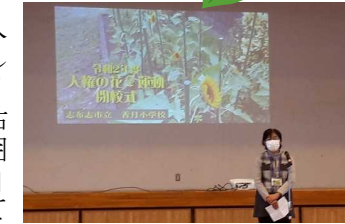
人権擁護員の講話