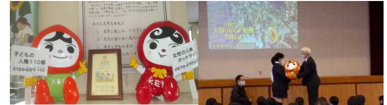
マスコットと感謝状を贈呈されました。