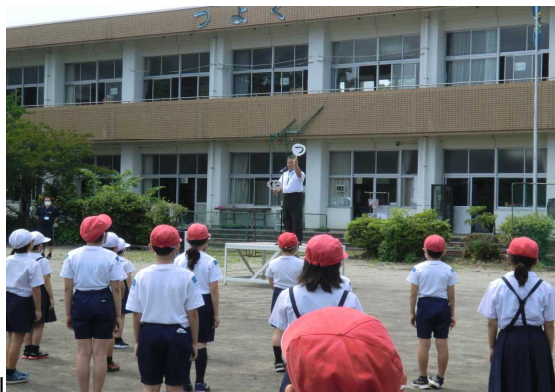
校庭で「3密」を避けた全校集会

その中で、「 強い子 」について、5日(金)の全校集会で、子供たちに話しました。「強い子は何が強い?」「体が強い子はどんな子供?」「心が強い子はどんな子?」「そんな子になるにはどうすればいい?」など子供たちに問いかけました。その内容については、下記のとおりです。学校と家庭が共通の認識で「 そろえる 」教育を進めていけたらありがたいです。