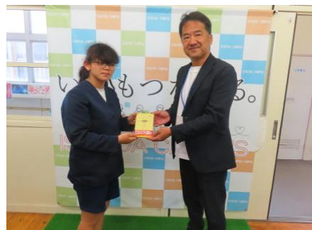
【サードブック贈呈】

そして、2023年より小学6年生卒業時に「サードブック」を贈呈する子育て支援事業を始めました。本をたくさん読んで好奇心や志の心を育て生活を豊かにしていきましょう。