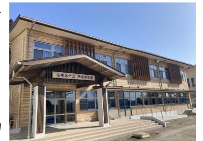
【伊崎田学園新校舎】

この1年間、保護者の皆様の御協力のもと、さまざまな教育活動を進めることができました。今年度も1年間ありがとうございました。