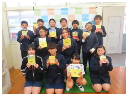
【サードブック贈呈式】