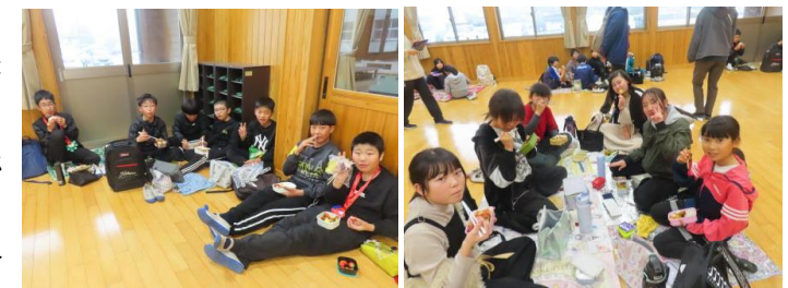
【お弁当タイム(6年男子)】 【お弁当タイム(6年女子)】

2月27日(金)、お別れ遠足を行いました。朝から降り続くあいにくの空模様のため、校内遠足としました。体育館やホール、教室等を使ってそれぞれ楽しんでいました。お弁当は、全校一斉にふれあい館のホールでいただきました。午後からは天候も回復して、外で元気に遊ぶこともできました。「6年生を送る会」も和やかに実施することができました。