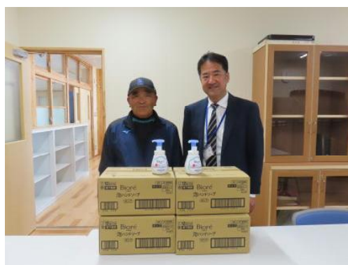
【ハンドソープを寄贈】