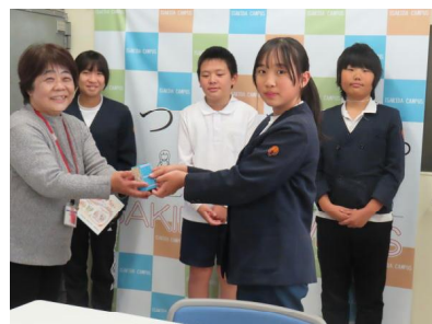
【社会福祉協議会へ】