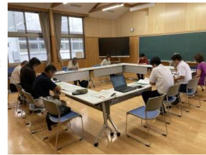
【学校運営協議会の様子】

今年度も伊崎田学園の学校運営協議会を計画的に開催しています。2学期は、中学校の文化祭や持久走大会に合わせて行いました。参加者の委員の皆様方から、児童生徒の活躍に対して温かいお褒めのお言葉をいただきました。新校舎建設の状況や4月からの「一貫校化」についての話題も出されました。さらによりよい伊崎田学園となるよう、前向きな意見が多数出され活発な話し合いが行われました。3学期は、委員の方々による小学校の授業参観や給食試食会も計画されています。