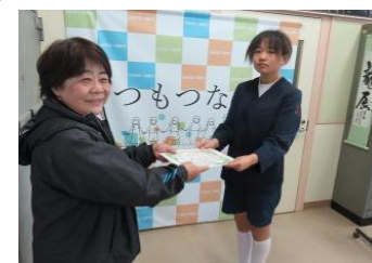
【ボランティア活動認定証授与】