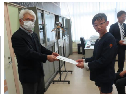
児童から留中様へ