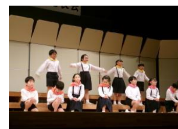
ボディパーカッション