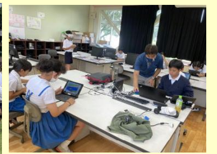
【プログラミングクラブ】