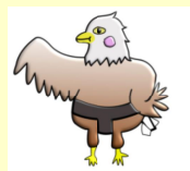
伊崎田学園マスコット 伊崎田わし

5月27日(火)に、「鹿児島交響楽団スクールコンサート」が行われました。伊崎田学園の児童・生徒はもとより、保護者・地域の皆様方も一緒に生の楽団の演奏を体育館で聞くことができました。40数人の楽団の方々の演奏やソプラノ歌手の歌声に魅了されました。とても、幸せな時間を過ごすことができました。ご支援いただきました「コバルト技研」の皆様方に厚くお礼も申し上げます。ありがとうございました。