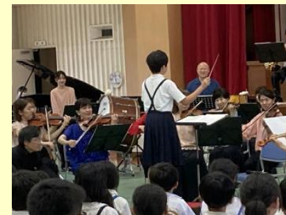
【スクールコンサート】

5月13日(火)に本年度第1回目の学校運営協議会が開催されました。委嘱状交付、会長・副会長の選出が行われました。小・中学校の今年度の学校経営方針が示されました。その後、「伊崎田学園の児童・生徒を増やすにはどうあればよいか」ということについて協議を行いました。活発な意見が出されました。「地域と連携した教育」をどのように行うべきか議論を重ねていきます。7月8日にも第2回学校運営協議会を開催しました。本年度も年間5回を計画しています。