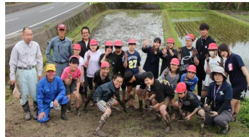
美味しいもち米ができますように！