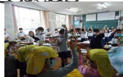
←いただいた感想から