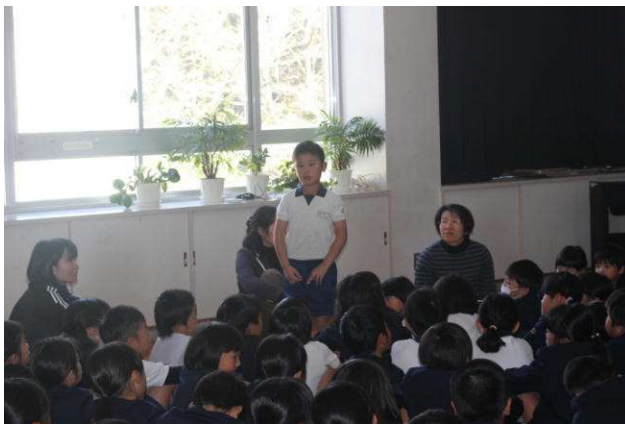
勇気を出して発表の2年生