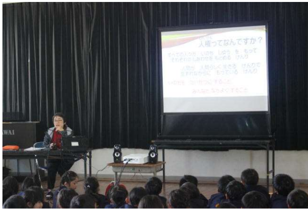
人権とは何でしょうか。