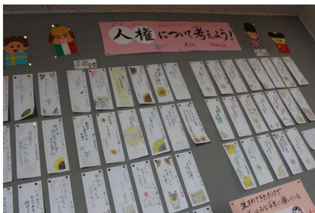
人権標語の掲示物