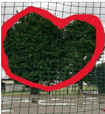
【校長室から見た銀杏の木】

学校は、子どもたちが安心して学び、職員がいきいきと働き、保護者や地域の皆様が温かく関われる場所であるべきです。人と人とのつながりの中で、互いを認め合い、支え合う関係が育まれることで、子どもたちの心も豊かに育っていきます。