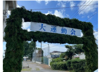
～立派な緑門ができました～

9月24日(日)、校庭の入り口にわかあゆ会の会員のみなさん、賛同頂いた保護者や子供たち、本校職員のご協力により、4年ぶりに緑門づくりを行いました。本当にありがとうございます。5m近くある立派な緑門は、校庭で本番に向けて練習する子供たちを見守ってくれています。10月1日(日)の運動会本番をどうぞお楽しみになしてください。