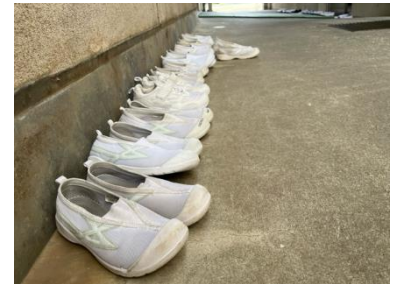
さすが！心がそろっています！